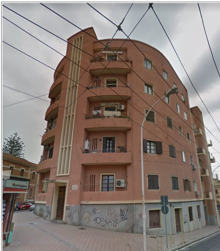
Vista dalla Piazza Kennedy