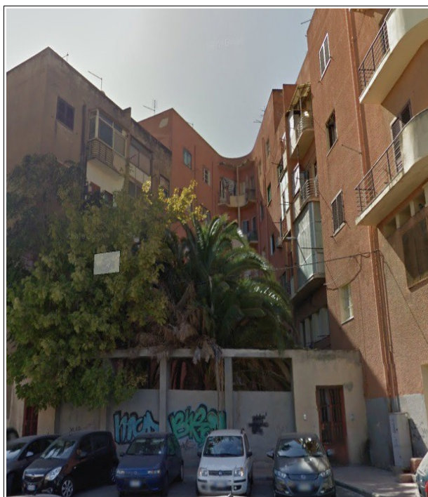
Vista lato cortile interno