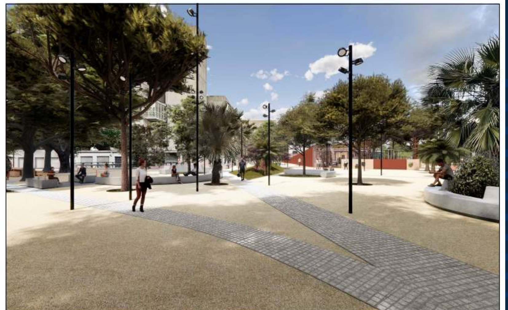
VISTA 4_STATO DI PROGETTO