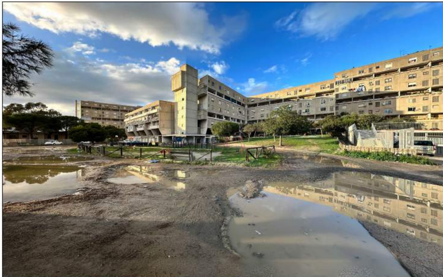
VISTA 5_STATO DI FATTO