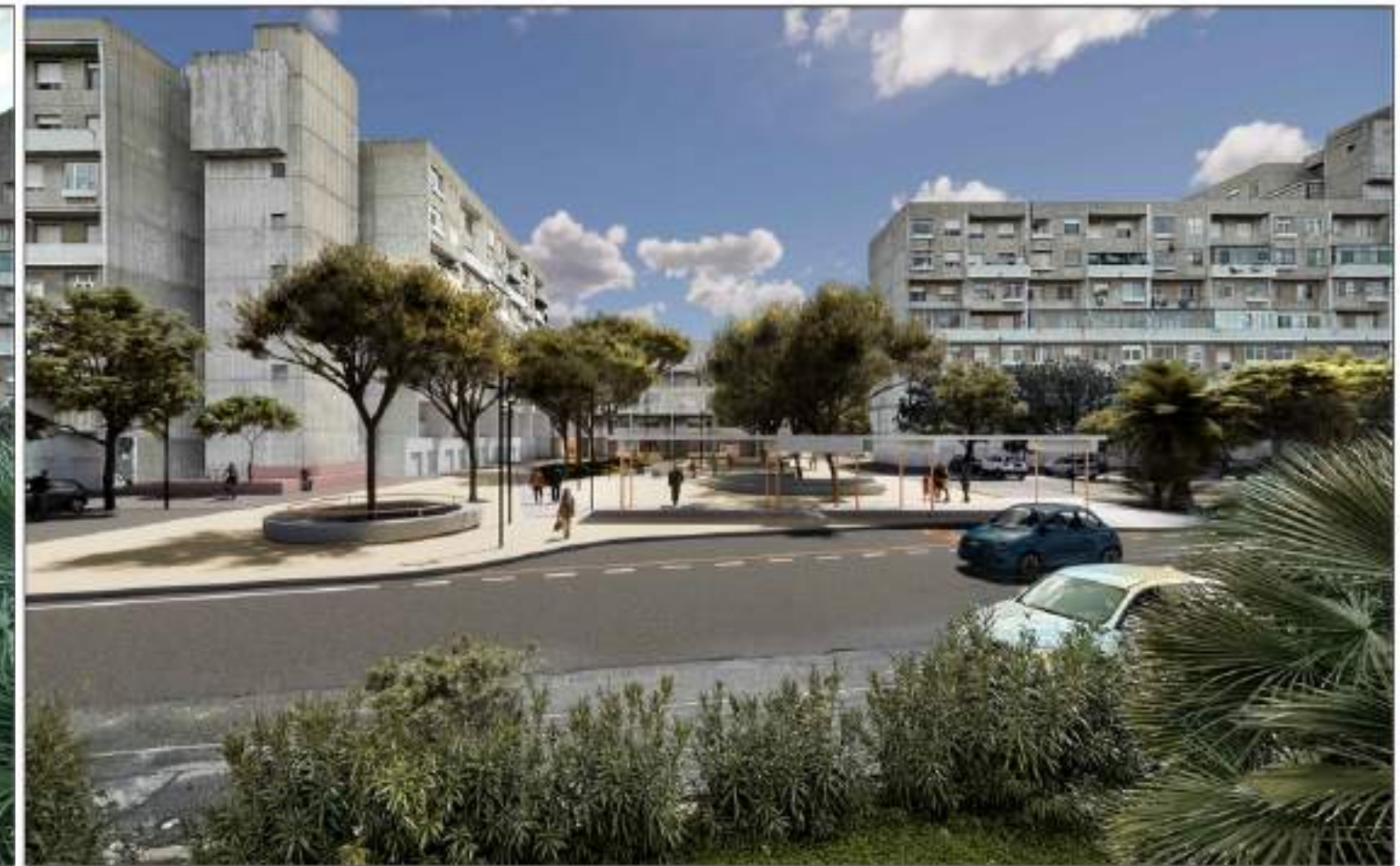
VISTA 1_STATO DI PROGETTO