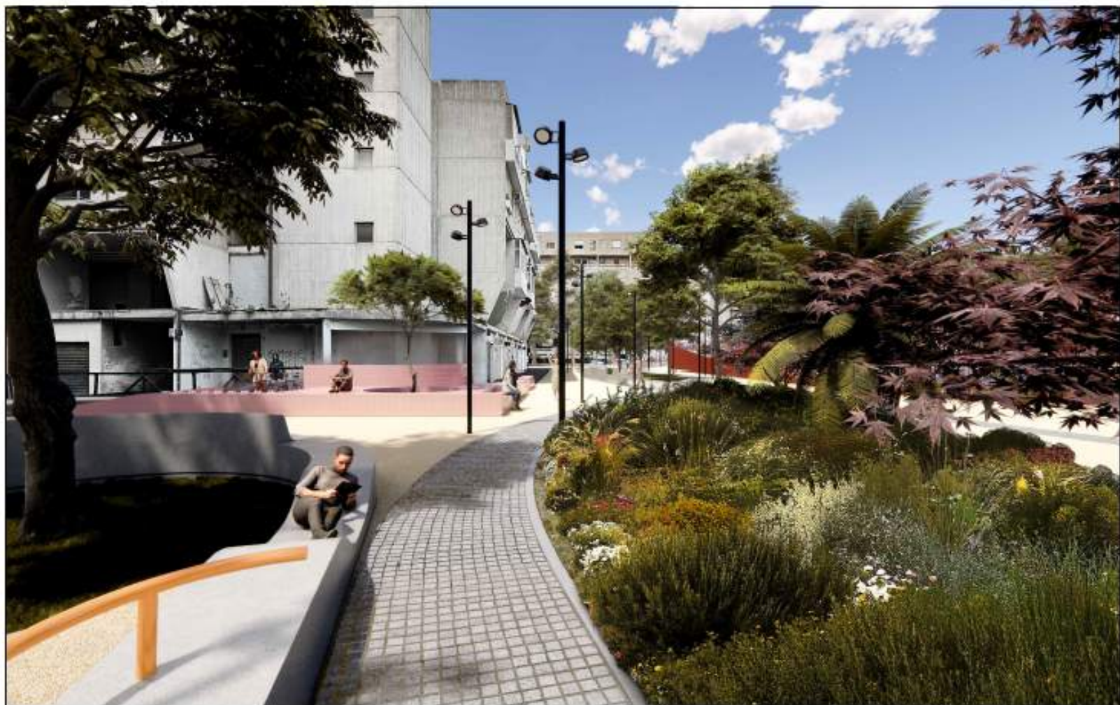
VISTA 3_STATO DI PROGETTO