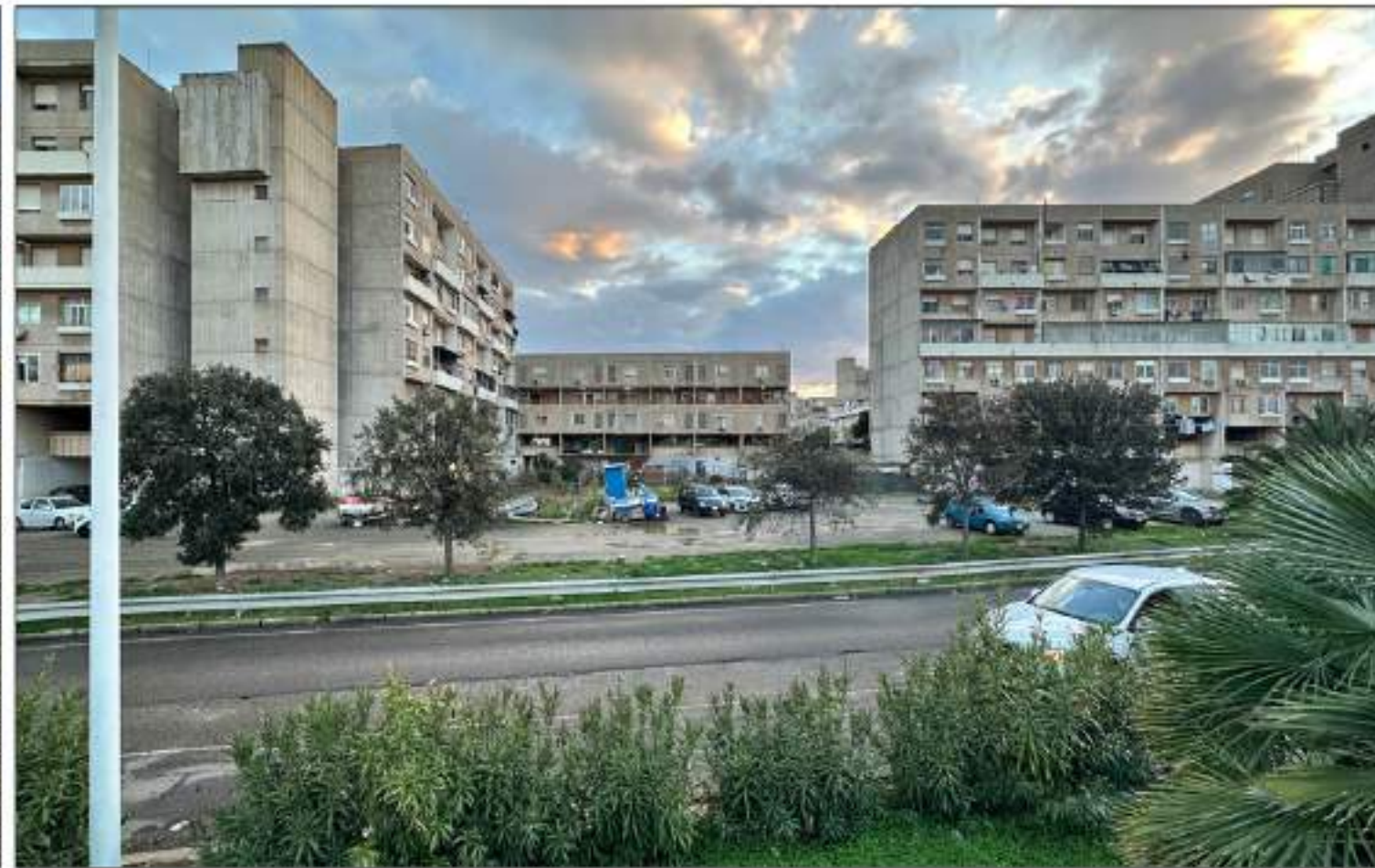
VISTA 1_STATO DI FATTO