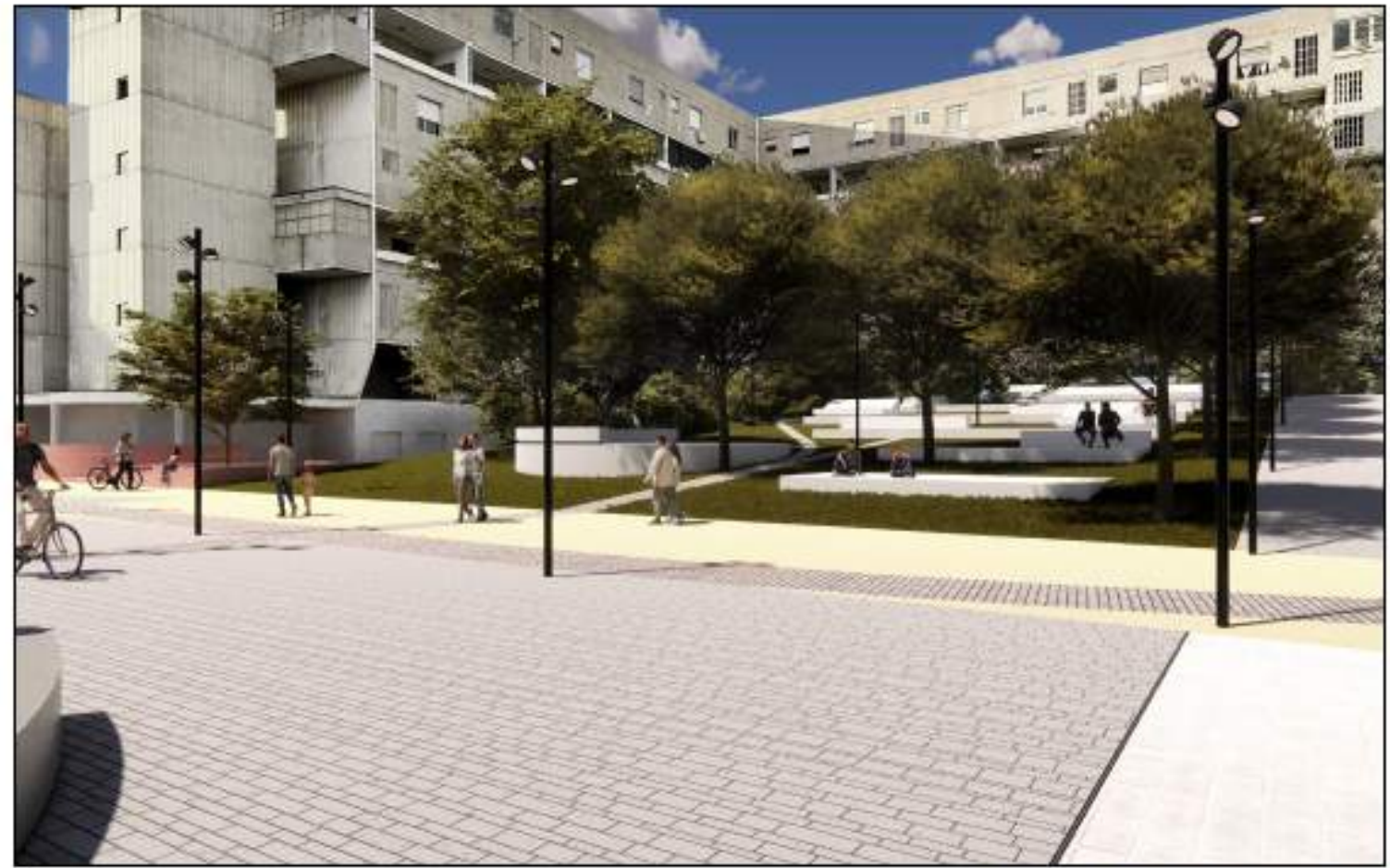
VISTA 6_STATO DI PROGETTO