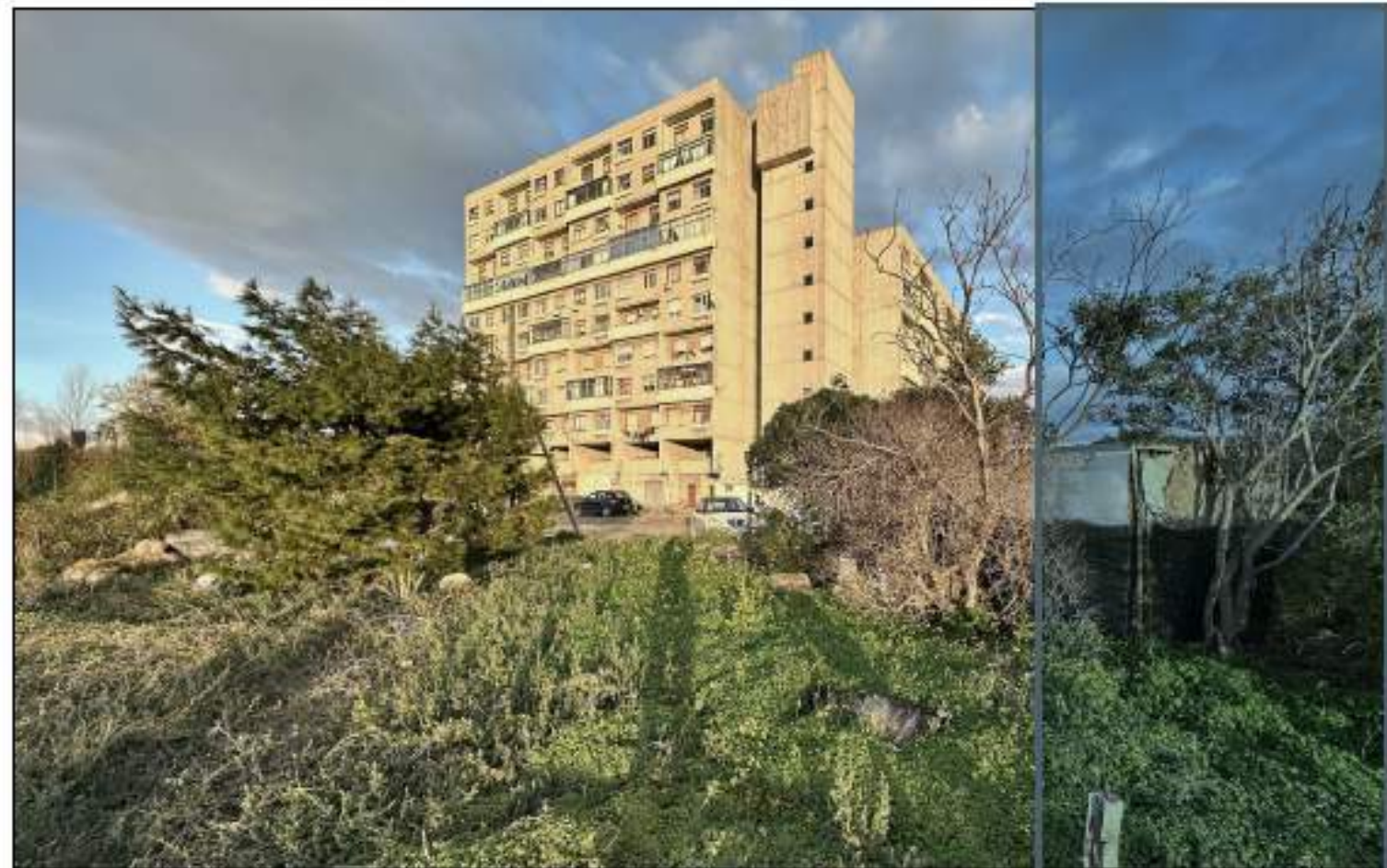
VISTA 7_STATO DI FATTO