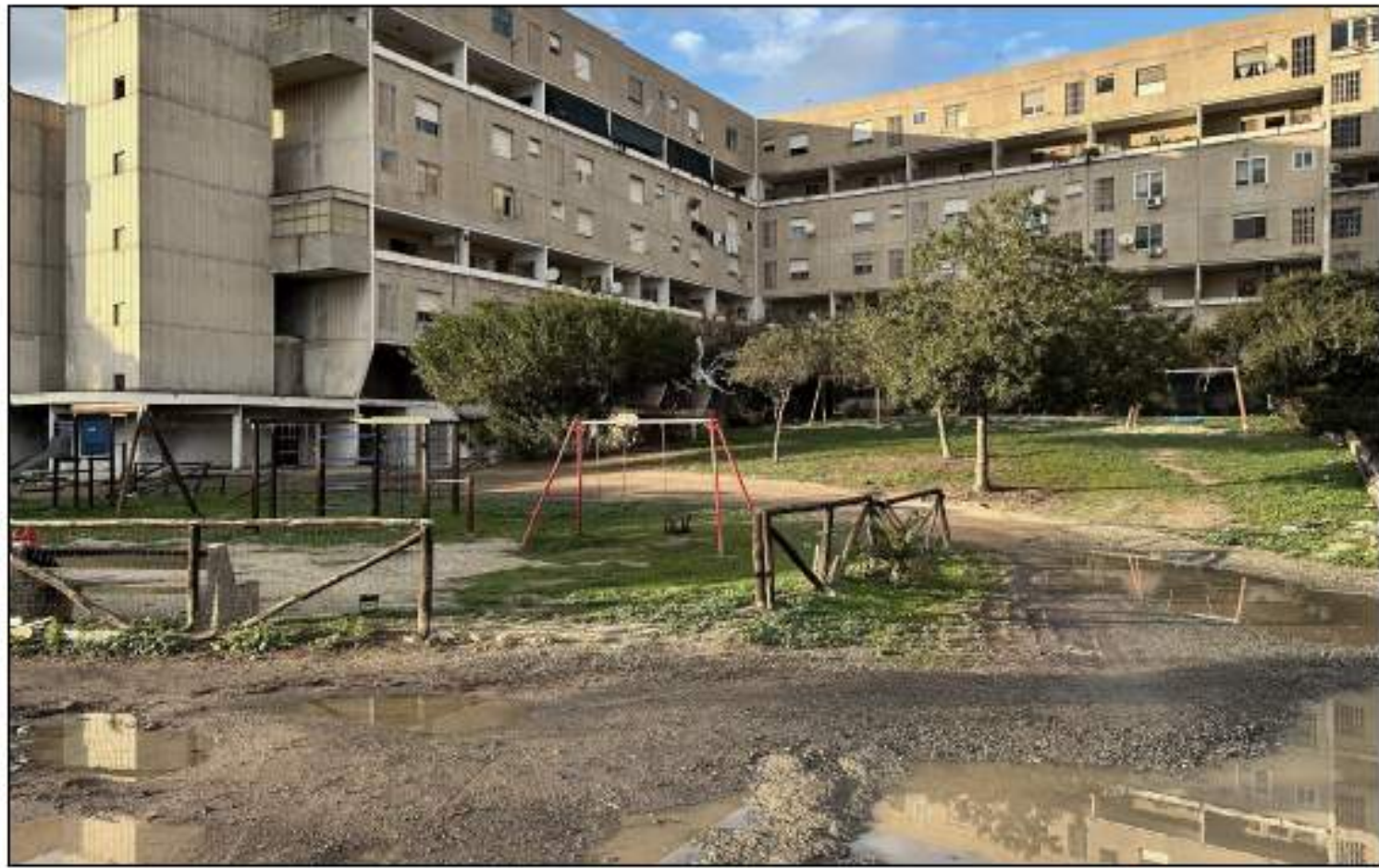
VISTA 6_STATO DI FATTO