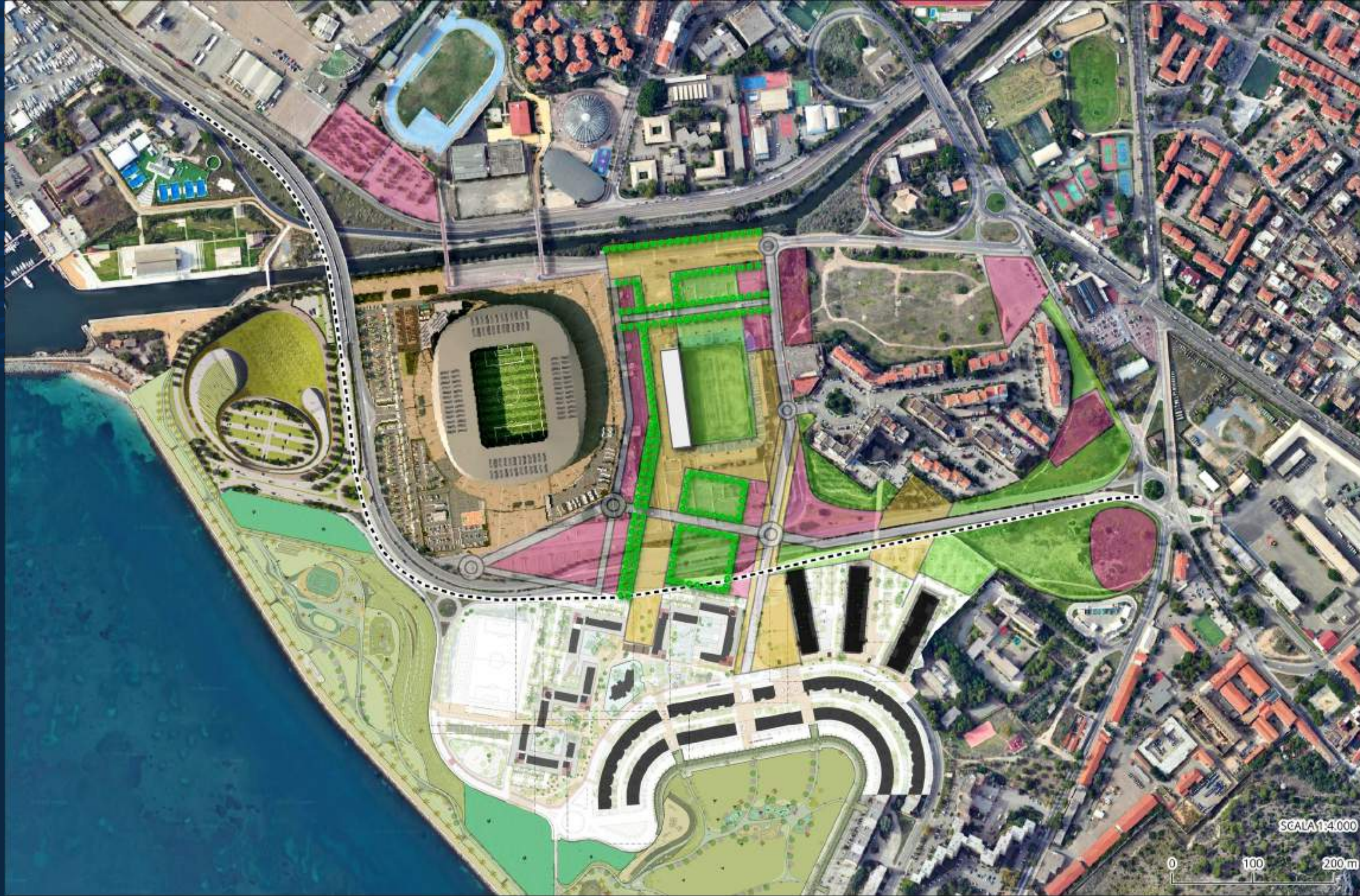
RIGENERAZIONE URBANA DEL QUARTIERE SANT'ELIA E DELLE AREE CIRCOSTANTI LO STADIO