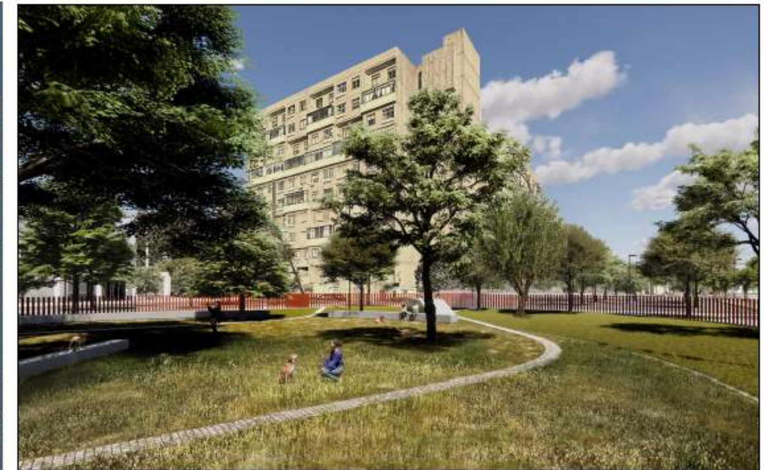
VISTA 7_STATO DI PROGETTO