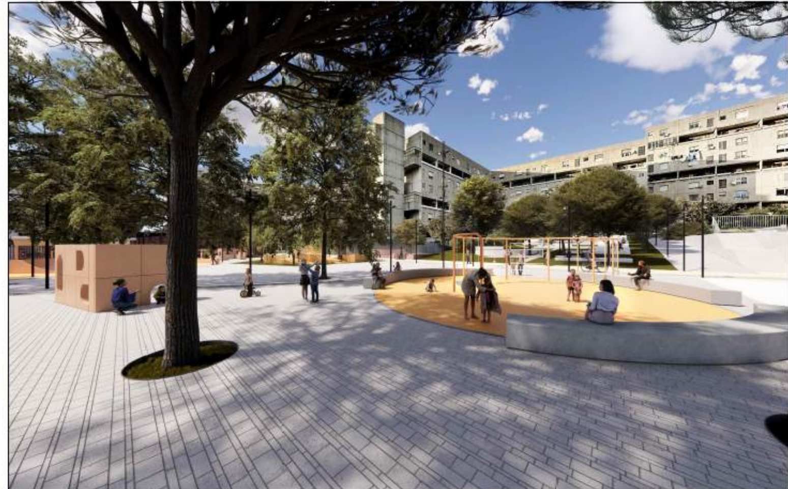
VISTA 5_STATO DI PROGETTO