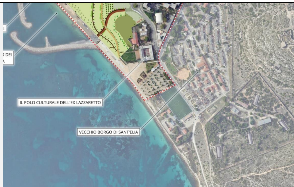
Fig. 2 "connessione Lungomare – Piazzale Lazzaretto

L'operazione si completa con l'ultimo intervento di "connessione" che prevede la riqualificazione della via Borgo Sant'Elia, strada che collega piazza del Lazzaretto alla cd. "Spiaggiola di Sant'Elia" e al percorso verso il Faro di Capo Sant'Elia, così come mostrato nella figura n.3