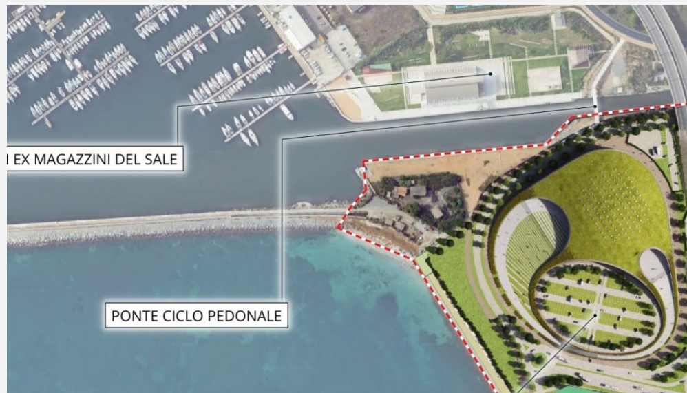
Fig. 1 "connessione ponte ciclopedonale - Via Vespucci

A tal fine, si prevede la conversione in viale, a prevalente funzione ciclopedonale, del tratto finale di via Vespucci e la creazione di uno spazio pubblico dedicato alla socialità e al collegamento tra il lungomare e la struttura del nuovo Palazzetto dello sport, in prossimità della testata del Parco degli Anelli.