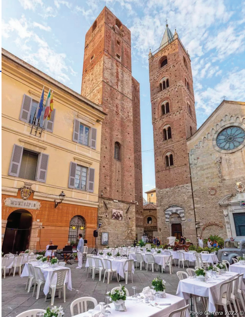
Paolo Carrera 2022 ©

che distintive formali, progetto, marchi, blog, sito, domini, sono protetti da copyright, deposito e registrazione.